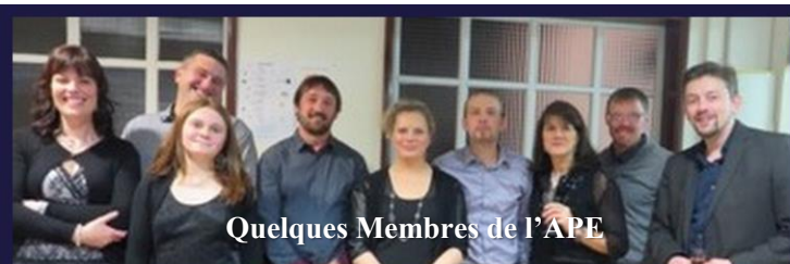
Quelques Membres de l'APE

Une fois encore, le réveillon de la Saint Sylvestre s'est parfaitement déroulé !