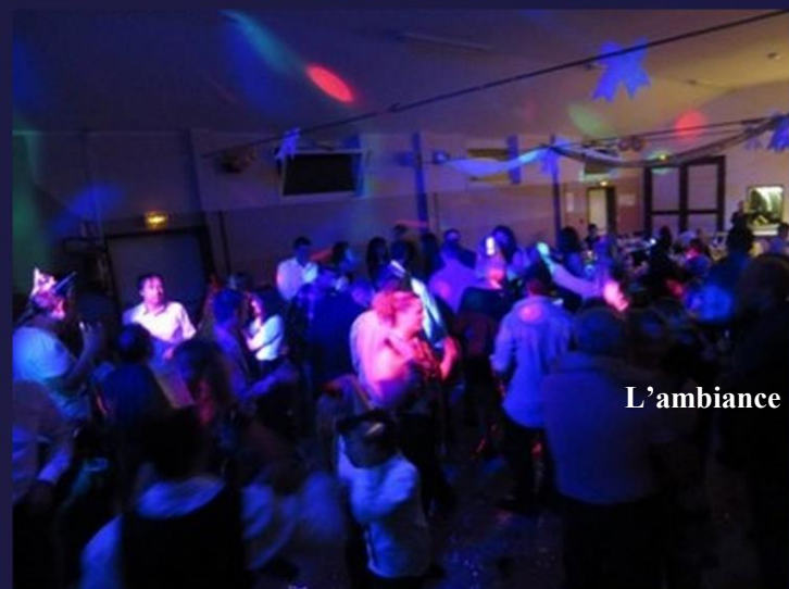
L'ambiance et la fête assurées...