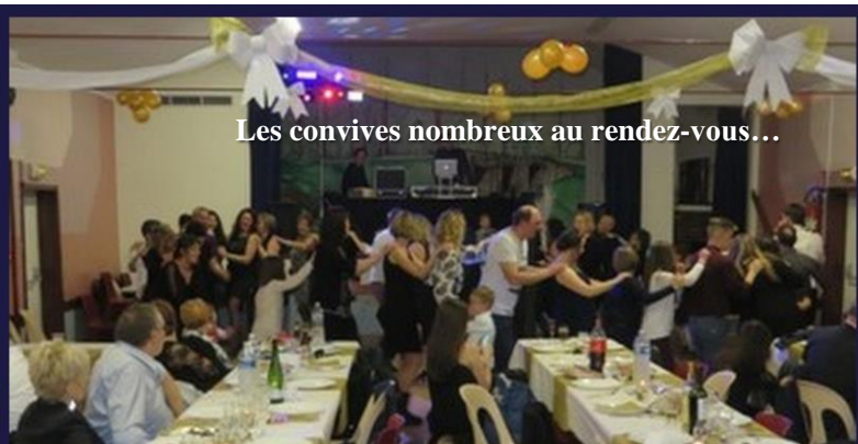
Les convives nombreux au rendez-vous...